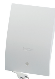
Master data collector (netgevoed)