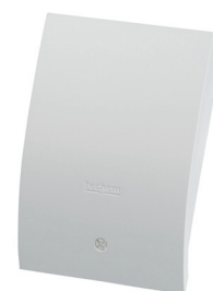
Data collector (batterij gevoed)

De netgevoede Master data collector bewaart alle verbruiksgegevens en de statusinformatie van het totale radiografie netwerk, welke bestaat uit meters en datacollectors. Tot 2.000 radiografische meters kunnen worden beheerd in één radiografienetwerk welke verschillende complexen kan dekken tot 60 data collectors in totaal, inclusief de Master data collector. Hij bewaart de verbruiksgegevens van iedere meter in zijn betrouwbare netwerk. Bovendien zorgt de Master data collector ook voor de communicatie met Techem via een GPRS modem over een beveiligde IP-VPN verbinding.